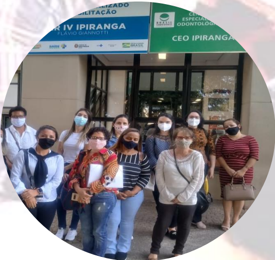
VISITA ÀS UNIDADES CER