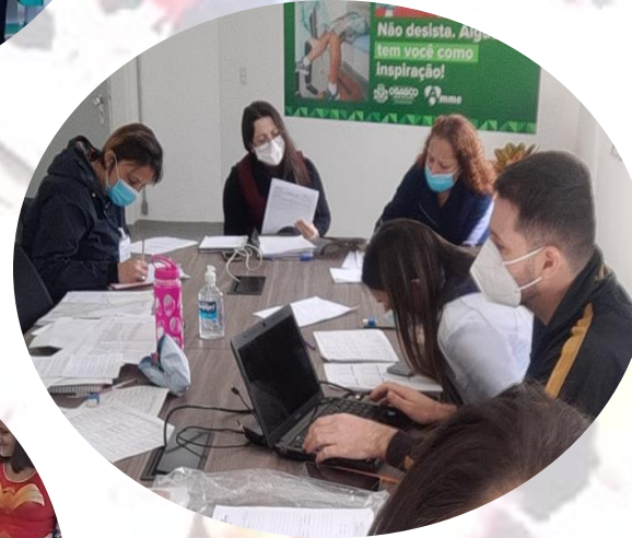
REUNIÃO EQUIPE TÉCNICA - PTS