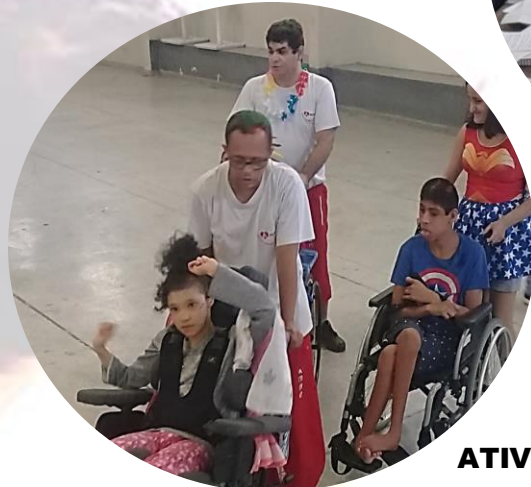
ATIVIDADE DE INTEGRAÇÃO